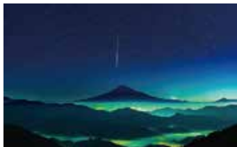
③ ナイトフォト 夕景、夜景、星空、星景 など

過去に撮影した写真もご応募ください。お一人様何回でも、何枚でもご応募いただけます。