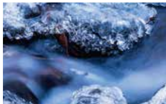
② 冬の風景 雪、氷、イルミネーション、雪の富士山 など