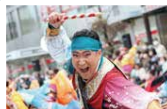
⑦ 祭り・イベント 踊り、火祭り、祭りの準備、冬の火花 など