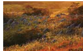
① 秋の風景 紅葉、もみじの絨毯、秋の花、ころも など