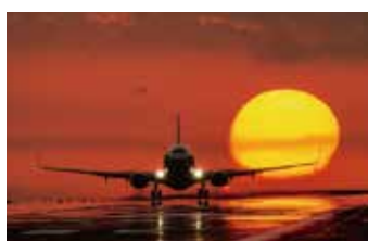
⑧ 乗り物 鉄道、飛行機、路面電車、船 など