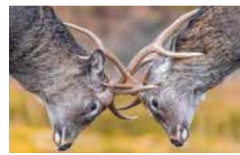
④ 動物 野鳥、昆虫、水中の生物、動物園 など