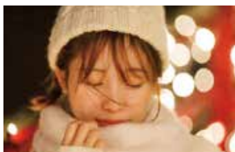
⑥ ポートレート 友人、季節の行事、モデルスナップ など