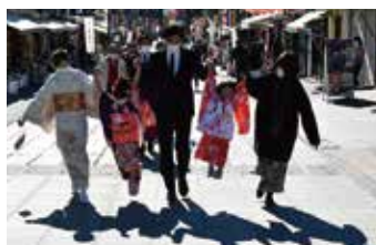
⑤ 家族・ペット こどもの成長、赤ちゃん、ペット など